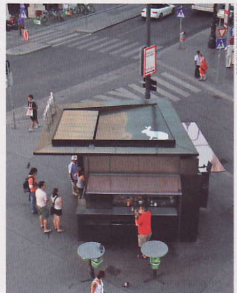
Blick herab von der Albertinarampe: Dürer reloaded Looking down from Albertina bastion