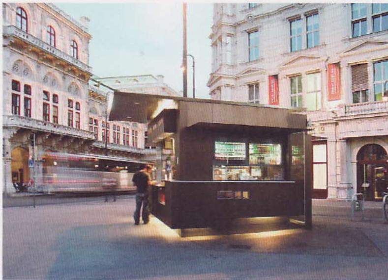
Kühlvitrine als integriertes Fassadenelement Cold-storage facade